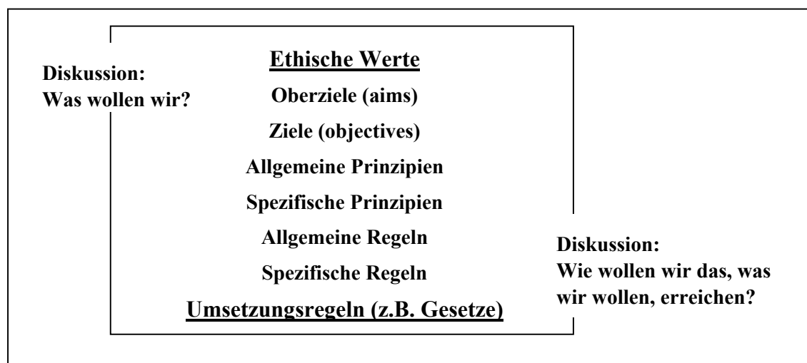
Abb. 1.: Verhältnis von ethischen Werten und Regeln ihrer Umsetzung